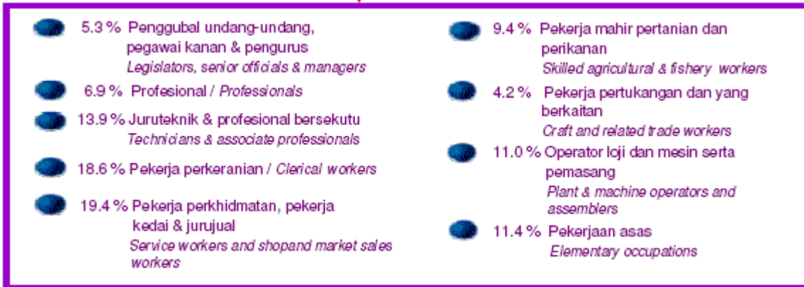
Carta 1.1 : Guna Tenaga Wanita, Malaysia 2006 ( www.kpwkm.gov.my )